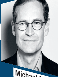
Michael Müller Regierender Bürgermeister Berlin