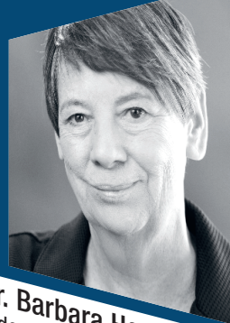
Dr. Barbara Hendricks Bundesministerin für Umwelt, Naturschutz, Bau und Reaktorsicherheit