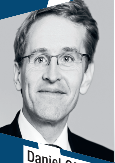
Daniel Günther Ministerpräsident Schleswig-Holstein