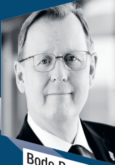
Bodo Ramelow Ministerpräsident Thüringen